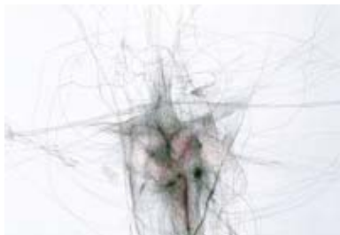
Sylvia Zumbach: Tuschestift und Farbstift auf Papier