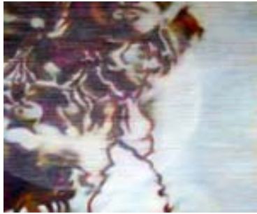
Gabriela Signer, «seen 18», 2010 Bienenwachs & Pigmente auf Leinwand, 100 x 120 cm