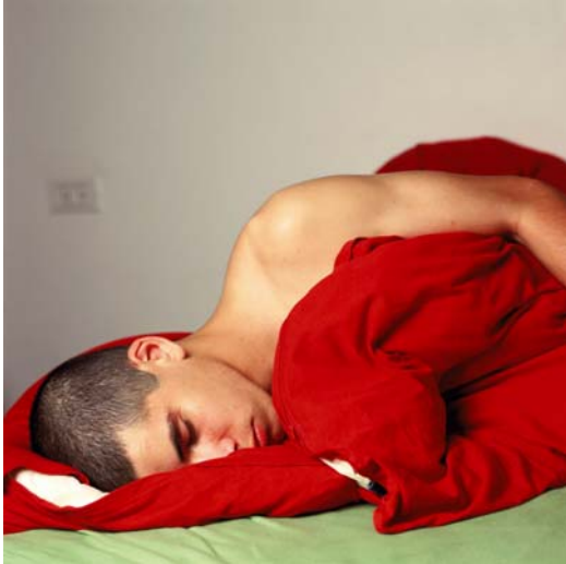
Naomi Leshem: Ofir , Israel, 2009. Aus der Serie „Sleepers“.