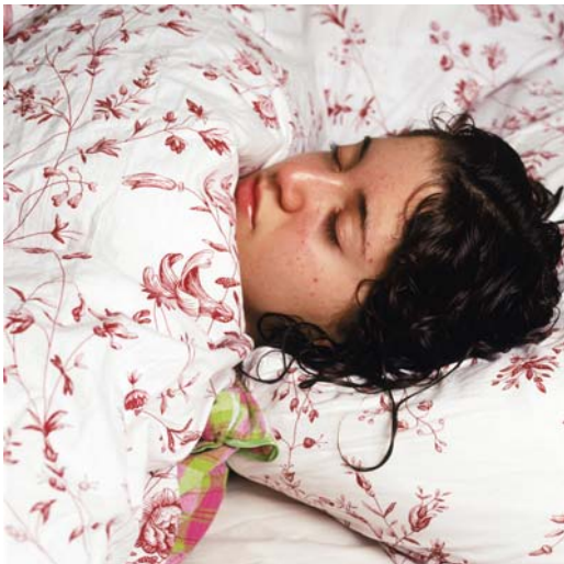
Naomi Leshem: Shahaf , Israel, 2008. Aus der Serie „Sleepers“. © Naomi Leshem / IG Halle