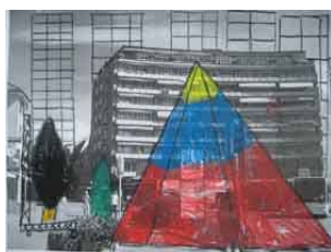
Bild 5 © Artefixprojekt Baukultur in der neuen Stadt 5.Kl. Schulhaus Hanfländer