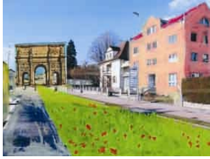
Bild 1 © Artefixprojekt Baukultur in der neuen Stadt Tatiana Witte artefix kultur und schule