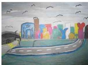
Bild 4 © Artefixprojekt Baukultur in der neuen Stadt 5. Kl. Schulhaus Hanfländer