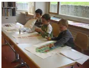
Bild 3 © Artefixprojekt Baukultur in der neuen Stadt Basisstufe Schulhaus Weiden