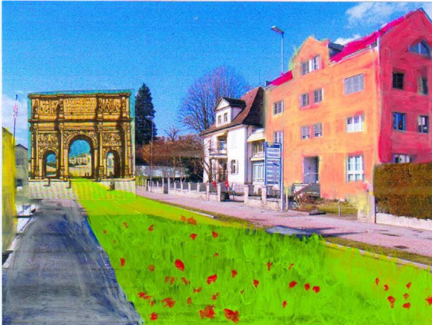
Tatiana Witte: Baukultur Neue Jonastrasse Rapperswil-Jona, Collage, 2007

Ein Projekt von artefix kultur und schule – 9. November bis 2. Dezember 2007