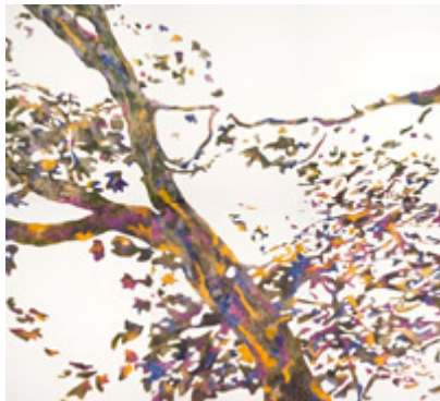
„Tree III“, 2010, Carborundum-Druck (6-teilig), 152 x 168 cm