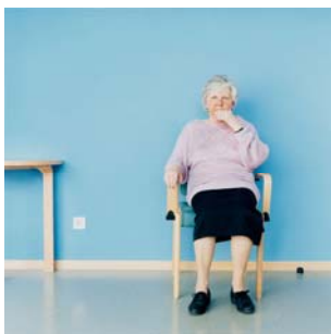
Observation 19, 2001