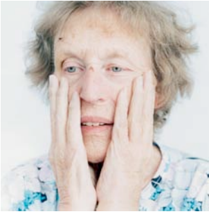
Portrait 3, 2001